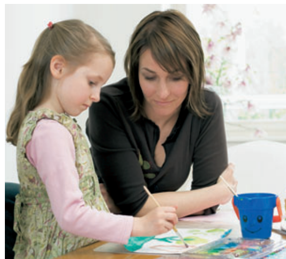
El incremento de los divorcios ha provocado un aumento del número de familias monoparentales.